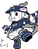
マスコット「ぬないくー」