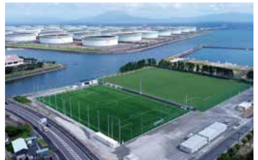
専用クラブハウスの整備へ